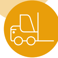
vorkhef-trucks en liften