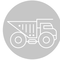
bedrijfs-voertuigen en -machines